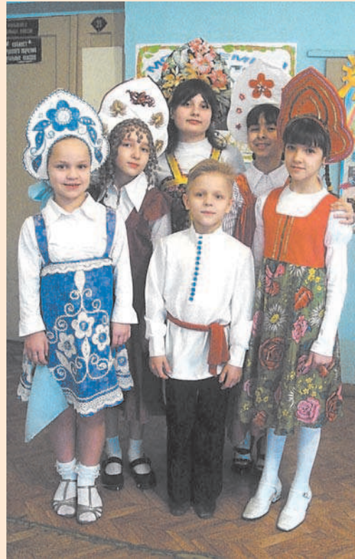
Школа №17, 6 класс