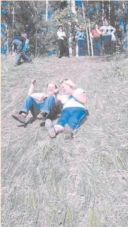
Школа №8, 8 класс