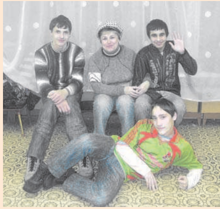
Гимназия №3, 11 класс