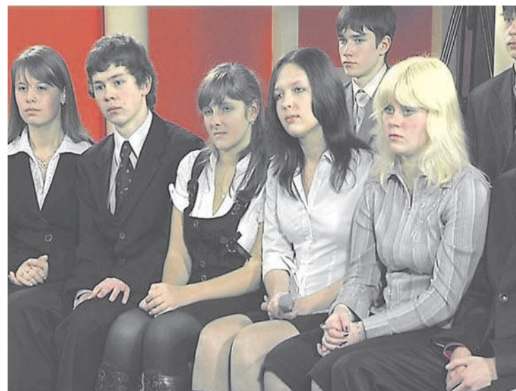
Полосу подготовила Полина Рыбакова

«Одна из главных черт папы – коммуникабельность, он интереснейший рассказчик. Мы часто и на разные темы спорим, при этом я понимаю, что мне нужно к нему прислушиваться, это очень важно для меня. Прожив столько лет вместе, хочется одного: любить и всегда быть рядом, поддерживать друг друга».