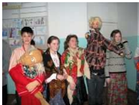
Проводы зимы- Масленица