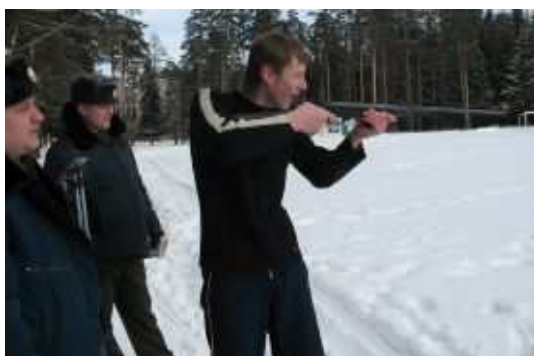
Военно- спортивная игра « Зарница»