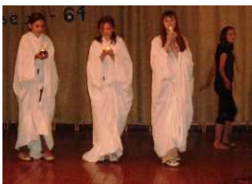
Школьный конкурс« Фабрика звёзд -64»