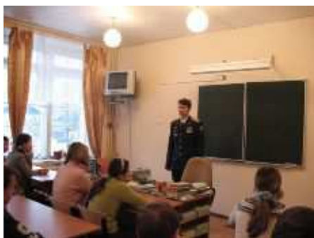
На уроке мужества офицер-лётчик

В школе проходит множество интересных школьных мероприятий, где ребята могут продемонстрировать свои таланты, а также принять участие в городских мероприятиях.