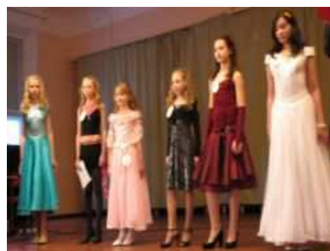
Школьный конкурс « Мисс школы»