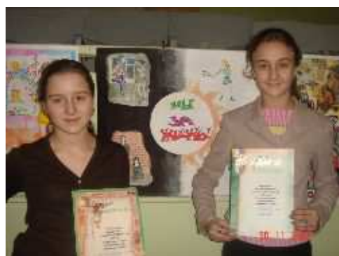
Конкурс « Открой свой мир»