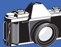
Фото принимаются на конкурс до 30 апреля!

Лучшие фото будут опубликованы на страницах газеты «Просто КЛАСС!». Фото можно присылать по элетронке prostoklass@inbox.ru в формате JPEG, принести в редакцию газеты «Просто КЛАСС!» в «Центр развития детской одаренности» ул.Громобоя,2, передать через корреспондентов газеты «Просто КЛАСС!»