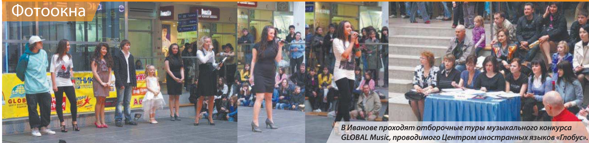
В Иванове проходят отборочные туры музыкального конкурса GLOBAL Music, проводимого Центром иностранных языков «Глобус».

Ивановская городская школьная газета ПРОСТО класс! Ивановская городская школьная газета «Просто КЛАСС!»