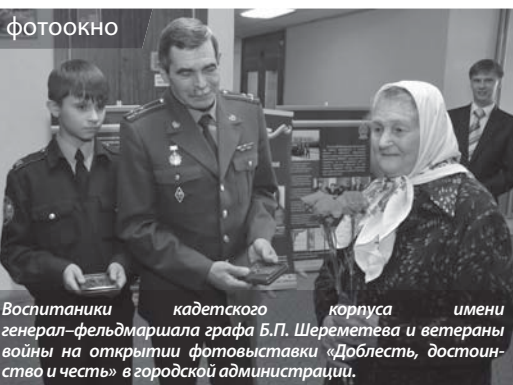
ФОТООКНО Воспитаники кадетского корпуса имени генерал-фельдмаршала графа Б.П. Шереметева и ветераны войны на открытии фотовыставки «Доблесть, достоинство и честь» в городской администрации.

От редакции. Подобные акции, вручение юбилейных медалей ветеранам прошли и в других школах областного центра.