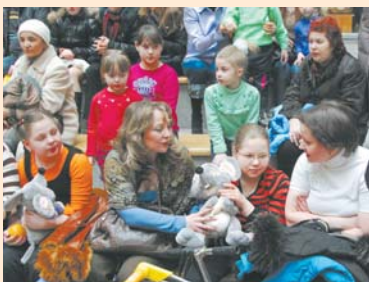
Участники доброго марафона-2009.

Мы не всегда дорожим своим здоровьем, считая его постоянной величиной. А как больно родителям видеть страдания детей, чьи возможности ограничены! Выдерживают не все. Некоторые отцы уходят из семей, бывает, беззащитные малыши оказываются в интернатах. Но смелые и любящие мамы посвящают им всю жизнь.