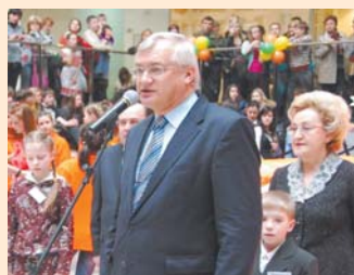
Власти не остаются в стороне от проблемы.

Раньше я могла работать, а теперь приходится сидеть дома, ведь мы с ней остались вдвоем. Проблема в том, что для того чтобы пойти оформить какие-то документы, приходится