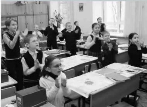
А это минутка здоровья в школе № 30.

Друзья, сохраняйте и укрепляйте здоровье, будьте дружны, как мы!»