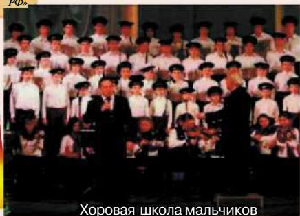
Хоровая школа мальчиков