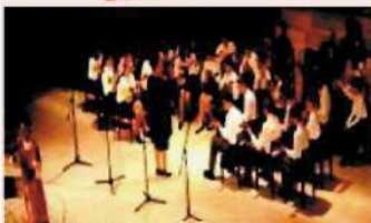
Оркестр Оркестр русских народных инструментов «Радоница»