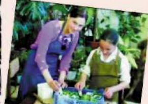
Школа цветоводства «Флорис»

22 октября городской Дворец детского и юношеского творчества собирает многочисленных участников форума учреждений дополнительного образования. «Наша новая школа» - это поддержка одаренных детей!