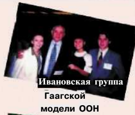
Ивановская группа Гаагской модели ООН