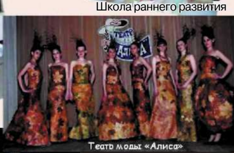
Театр моды «Алиса»