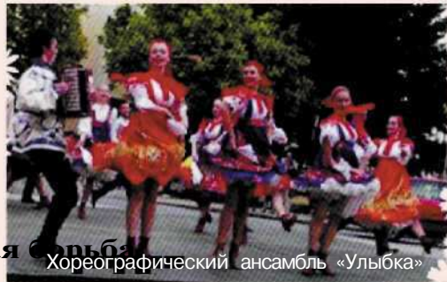
Хореографический ансамбль «Улыбка»