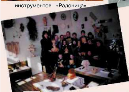
Школа художественных ремесел