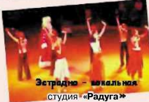
Эстрадно-вокальная студия «Радуга»

Наш девиз: Талант дается богом даром, и потому зовется даром, Дается даром и руду, Носколько требует труда!