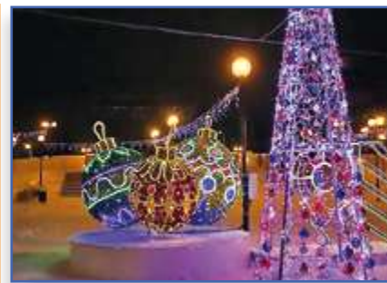
Ёлочки "с характером"