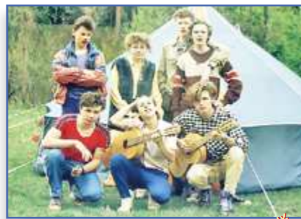
Летопись лицея № 33