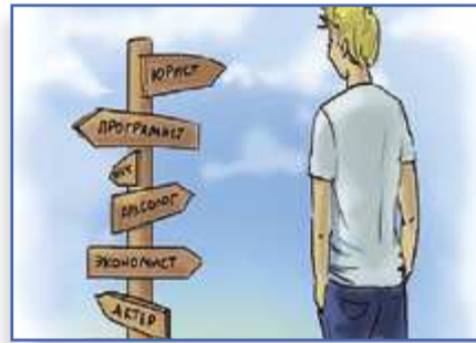
Время первых шагов с. 8-9