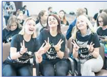
#Управляем_Сами с. 6-7