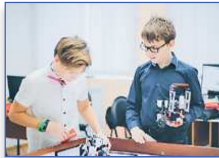
"Перспективное" направление с. 5