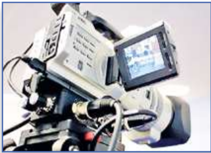
Как наши кино снимали... с. 3