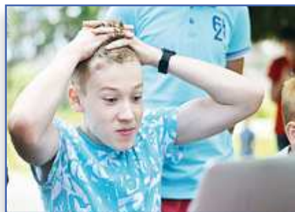
Не шкодить, а кодить с. 4