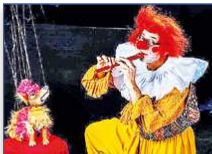
"Из театра я не уйду!" с. 10