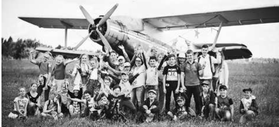
По "Городу легенд" с "Перспективой"