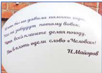
"Нас не забудут ПОТОМУ ВОВЕК..." с. 2