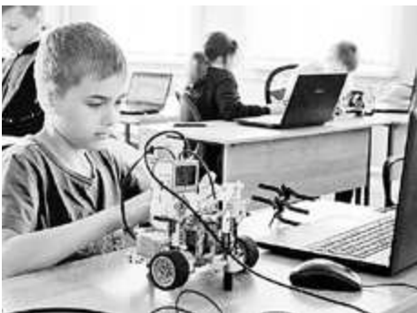
В "Новации" всё по-новому

О путях усовершенствования системы образования на Педагогическом совете было сказано много, дело остается за «малым» – объединиться с учениками в работе над тем, чтобы образование было только в радость и приносило большие успехи.