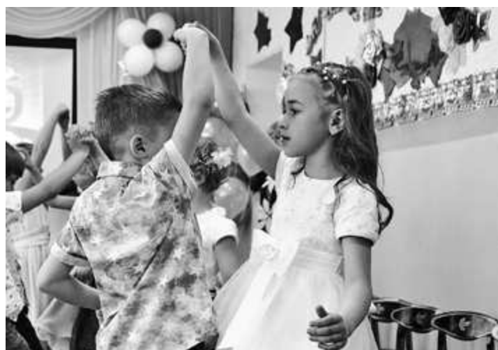
Всё начинается с "дошколки"