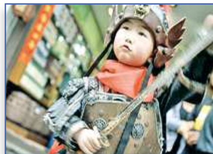
Простоклашка с. 5-8