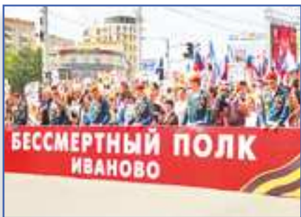
В память об ушедших