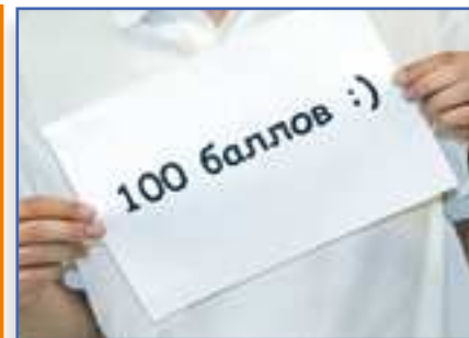
Сдать экзамен про100