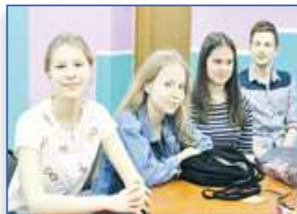
Место встречи – "ПК!"