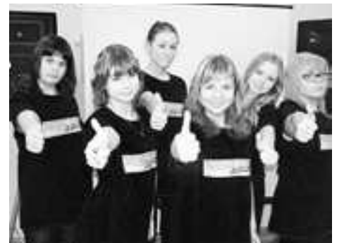
Как дела? – Просто класс!